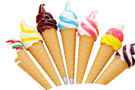
Eis für die Schule