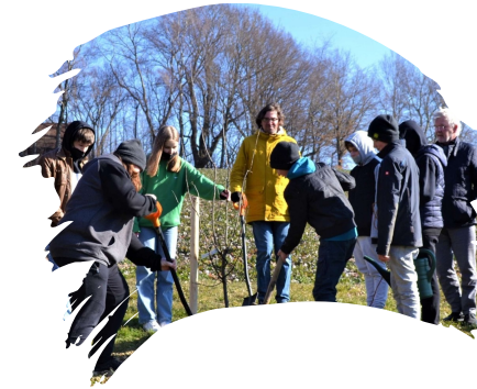
Nachhaltigkeit und Klimaschutz